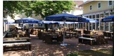
Terrasse (200 Plätze)