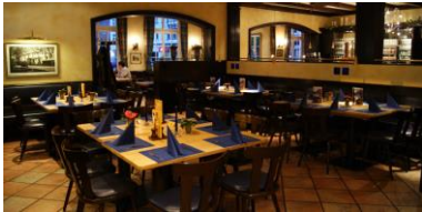
Restaurant/ Frühstücksbereich (140 Plätze)