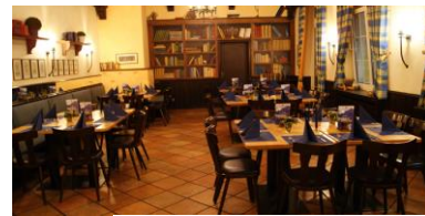
Kaminzimmer (50 Plätze)