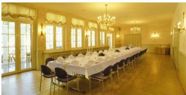
Bistro (90 Plätze)