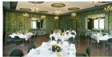
Spiegelzimmer (100 Plätze)

Wienecke XI. Hotel Hannover GmbH Hildesheimer Str. 380 · 30519 Hannover reservierung@wienecke.de Tel. 0511/12 611-0 Fax 0511/12 611-511 Geschäftsführer: Andreas Wienecke HRB 55298 Amtsgericht Hannover USt.ID-Nummer: DE 175 681 093 Hannoversche Volksbank eG. BIC VOHADE2HXXX IBAN: DE 95 2519 0001 0111 0462 00